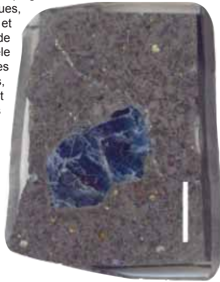
Fig.MFP3. Xénocrystal de saphir bleu inclus dans un basalte alcalin du Changle (Chine). échelle : 1 cm de long

rubis nous permettra d'établir une carte d'identité minéralogique et isotopique pour chaque gisement avec une application certaine à la certification commerciale. Les chantiers sont répartis sur les différents continents: Afrique (Cameroun, Tanzanie, Nigéria, Madagascar), Asie (Chine, Vietnam, Australie), Europe (France), Amérique du sud (Colombie), Amérique du Nord (Etats-Unis)